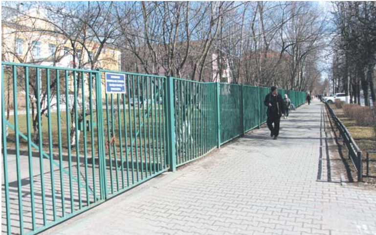
Эти ворота возле школы №8 заваливали зимой снегом, что мешало служебным машинам попасть на территорию

Уборка тротуара со стороны ул. Мира рядом с учебным заведением оставляет желать лучшего. За этот год произошло несколько случаев, когда школьники из-за падений получили травмы. Данная дорога и ее содержание находятся в ведении управления «Мо-