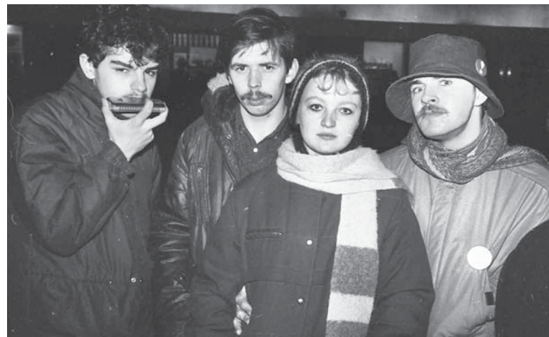
Архивные фото агитбригады факультета электроники и системотехники (ФЭСТ) МГУЛ

Все бывшие участники агитбригады «ФЭСТа» по-своему благодарны за то, как сложилась их судьба. Кто-то обрел в студенческие годы свою семью,