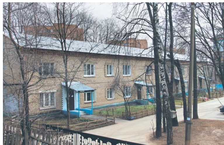
Дома 2а, 4 и 4а по улице Институтской в прошлом году обзавелись новыми кровлями

Добраться до инженерных коммуникаций бывает сложно и по другим причинам. Например, взять один из трехэтажных домов по ул. 3-й Крестьянской. «Жители привыкли, что у них в подвалах и кладовках бочки с квашеной капустой, старые санки, детские коляски – то, что копилось десятилетиями. И там же находятся инженерные сети. А тут зима, труба лопнула, но доступа в подвал нет: висит большой амбарный замок. Узнаем