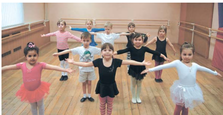
Самые маленькие воспитанники Пироговской детской школы искусств

Пироговская детская школа искусств – единственная сельская школа в городском округе Мытищи, имеющая свое здание и ведущая образовательную деятельность практически по всем направлениям дополнительного образования. В последние годы Пироговская СДШИ заняла прочные позиции в культурном пространстве не только Мытищ, но и Москвы и Московской области. Она стала центром культурной жизни для населения и выполняет свою главную задачу – образовательное, духовно-нравственное, патриотическое воспитание детей, подростков и жителей. Всего в данный момент в школе обучается около 300 человек.