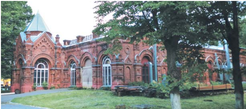
Водоподъемная станция, 1890 г.

каменную сторожку, деревянный дом заведующего станцией (ныне это дирекция Мытищинского водоканала, координаты 55.896489, 37.778114), чугунную ограду, резервуар для нефти (55.895051, 37.778930), спроектированный