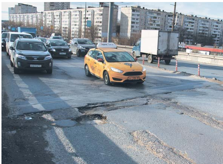
Совсем скоро на эстакаде Олимпийского проспекта начнется капитальный ремонт

Иногда жители сами проявляют инициативу и обращаются в администрацию с просьбами организовать проезжую часть в том или ином месте. Последнее время больше всего обращений касается эстакады на Олимпийском проспекте. Эта дорога уже давно находится в плачевном состоянии и требует капитального ремонта мостового полотна. К сожалению, из-за погодных условий полностью привести асфальтовое покрытие в порядок было невозможно, тем не менее особо опасные участки периодически подвергаются ямочному ремонту.