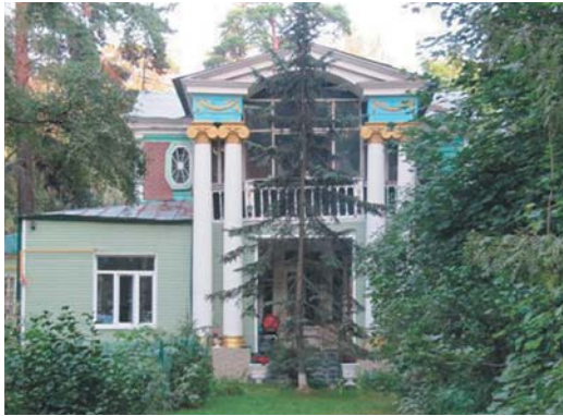
В доме Михайлова часто бывал известный оперный певец Леонид Собинов

Движемся по тропинке на север 1,1 км до улицы Соловьева, д. 5 –