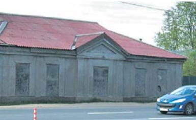
Почтовая станция (сносена в 2015 г.)