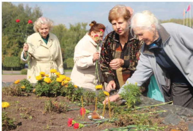
Ветераны возложили цветы и зажгли поминальные свечи