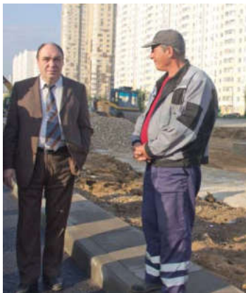
Глава города Александр Казаков остался доволен проделанными работами

12 сентября открыто временное движение по одной половине дороги, вторая часть еще требует не некоторых доработок. Задержка произошла из-за перекладки газопровода. Сейчас рабочим предстоит заасфальтировать участок, ведущий к бульвару Ветеранов. В конце следующей недели планируется открыть дорогу полностью. Стоит отметить, что глава города А.М. Казаков остался доволен проделан-