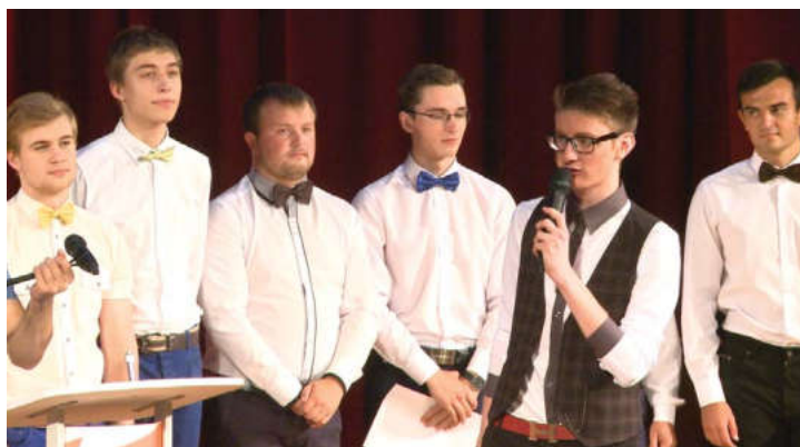
Участники фестиваля порадовали зрителей своим искрометным юмором, смешными миниатюрами, великолепной импровизацией