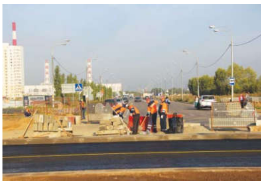
Отремонтированная улица Юбилейная позволит снизить транспортную нагрузку в этом районе