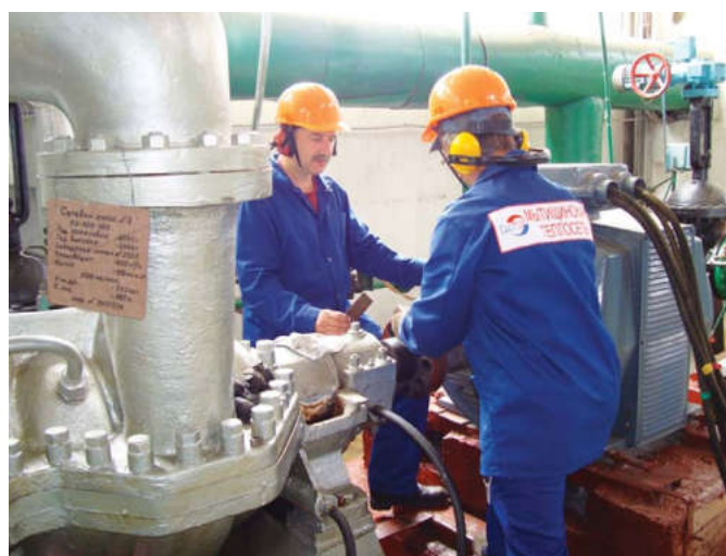
Профилактический осмотр сетевого насоса на городской тепловой станции ГТС 1, обеспечивающей теплом половиной жителей Мытищ

каждом многоквартирном доме, на каждом социальном объекте.