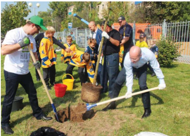
Акция «Наш лес. Посади свое дерево» прошла у «Арены Мытищи»