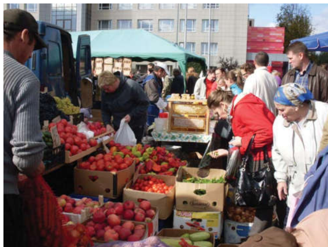
Как правило, цены на ярмарках выходного дня значительно ниже, чем на рынках и в торговых сетях