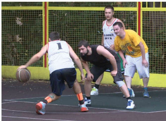
В этом году 8 команд принимают участие в соревнованиях по стритболу