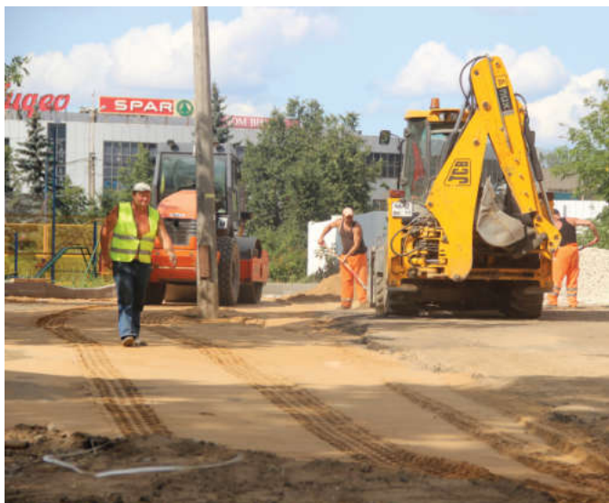
Ремонт дороги на проезде с улицы Карла Маркса к домам 3 и 7 по Олимпийскому проспекту

В городе продолжают работы по благоустройству территорий и ремонту дорог.