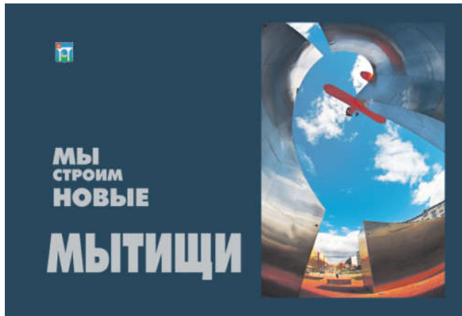
Новую книгу вполне можно назвать народной