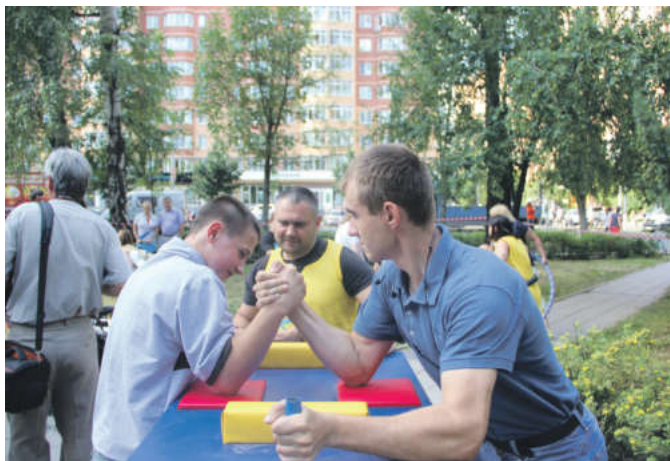
Спортивные развлечения были на любой вкус

22 июля возле торгового центра «Перловский» прошел спортивный праздник для жителей нашего города, направленный на пропаганду спорта и здорового образа жизни. Его организация состоялась благодаря активистам из молодежного центра «Звездный».