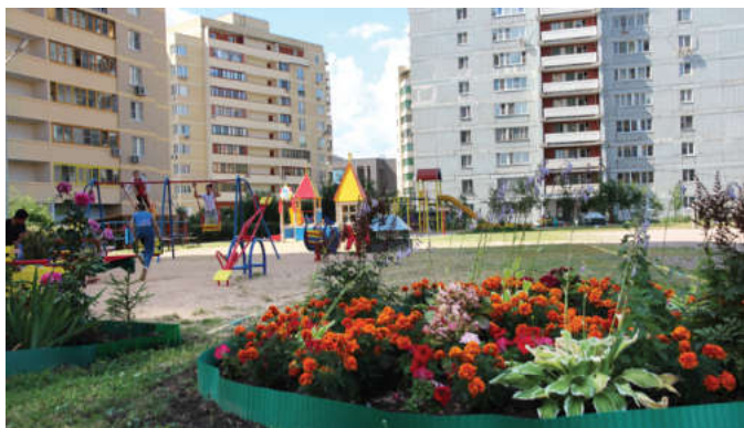
Дворовая территория на улице Воровского, дом 1

Судя по отзывам мытищинцев, наш город год от года растет и хорошеет, городские власти стремятся сделать жизнь жителей удобной и комфортной. Ремонтируются дороги, внутриквартальные проезды, решаются транспортные проблемы. Кстати, еще в 2006 году Мытищи стал победителем всероссийского конкурса в номинации «Самый благоустроенный город Рос-