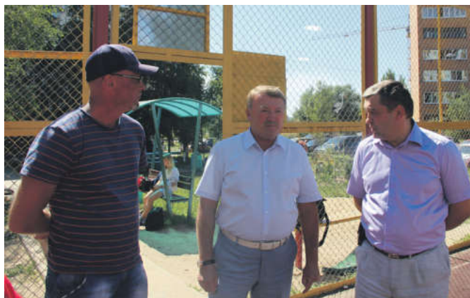
Возрождение дворового спорта в Мытищах является приоритетным направлением

«Самое главное – систематически проводить уборку. Следует приобрести необходимый инвентарь. В целом состояние спортплощадки удовлетворительное, однако на следующий год