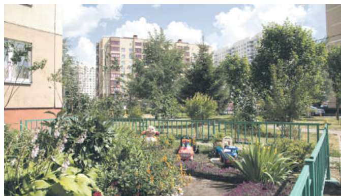
Вот такой цветник разбит возле дома № 21 на улице Сукромка

Конечно, год от года конкуренция среди участников усиливается. Каждый хочет показать красоту своего двора, особенно, если к его благоустрой-