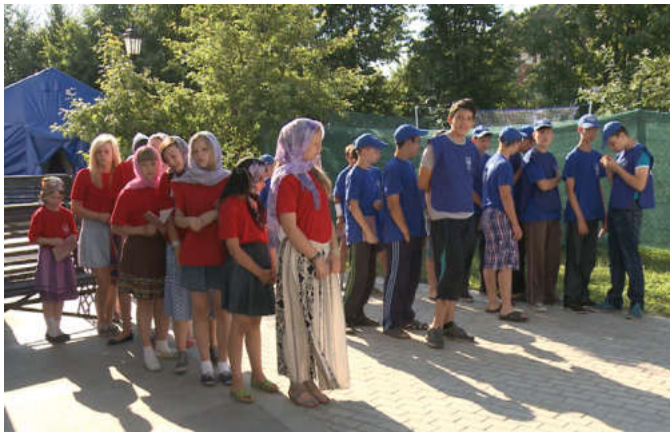
Лагерь в Троицком работает третье лето