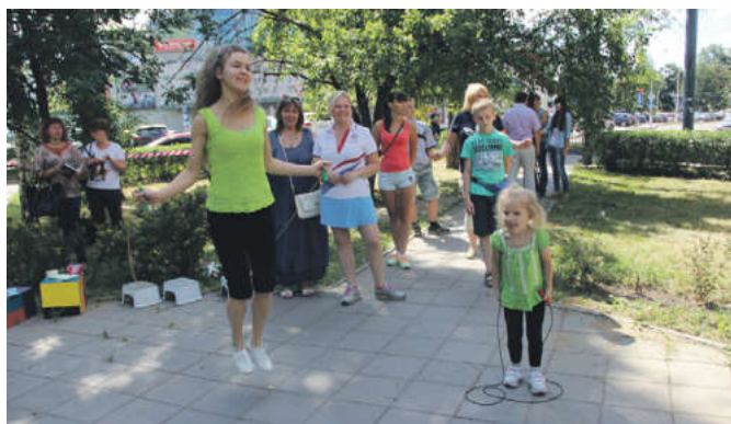
В мероприятия и приняли участие мытищинцы всех возрастов

Несмотря на будний день, людей в сквере возле «Перловского» собралось немало. Жителям и гостям города было приятно ненадолго отвлечься от своих повседневных дел, а детям – по-настоящему насладиться летом. Такие неожиданные праздники всегда приносят много радости и позитивного настроения.