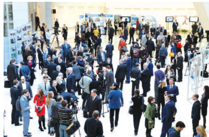
В Дом правительства Московской области была приглашена делегация из Мытищинского района

ведь большая часть бюджета – расходы в этой сфере. Особого внимания заслуживает развитие гражданского общества. Власти должны не бояться вступать в прямую и, что важно, регулярный диалог с людьми.