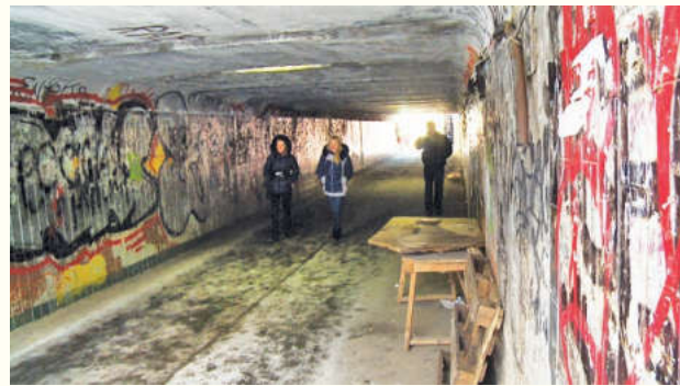
Полосу подготовила Эльвира Курганская

Ситуация с состоянием перехода под эстакадой на Олимпийском проспекте находится на контроле администрации городского поселения.