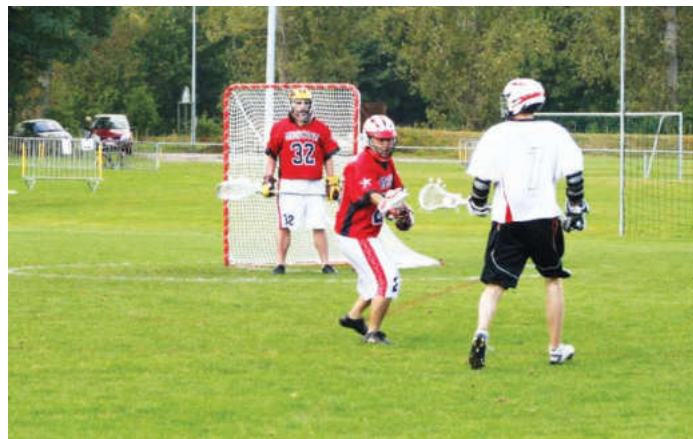
«Moscow lacrosse club» 1 февраля проведет в Мытищах внутриклубный турнир

В Мытищах «Moscow lacrosse club» проведет свой внутриклубный турнир. 1 февраля в спортивном ком-