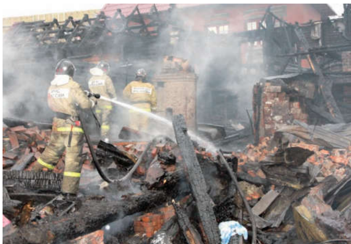
Многие погорельцы вспоминают известное выражение: «Вор оставляет хотя бы стены, а пожар – ничего!»

На следующий день на пулз пожарной охраны поступило сообщение о возгорании в пятиэтажном доме на улице Терешковой. Оказывается, на