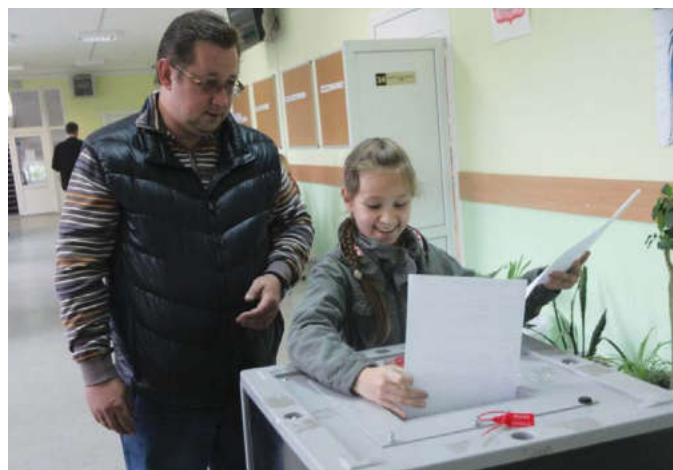
Отдать голоса за своих кандидатов приходили все, кому небезразлично будущее нашего города и района

По данным официального сайта Мытищинского муниципального района