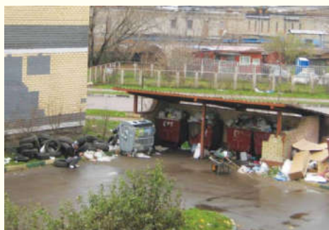
Вот так выглядела контейнерная площадка совсем недавно

К счастью, в нашем городе вводят истории, которые заканчиваются в пользу жителей.