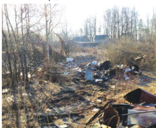
В последние десятилетия водоемы оказались заброшенными и никому не нужными