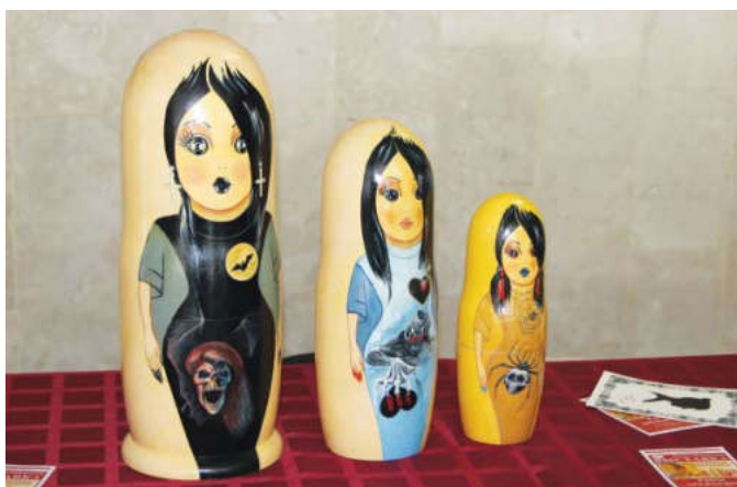
Матрешки, изготовленные талантливой художницей, находятся в частных коллекциях многих стран мира

Русская матрешка на протяжении нескольких веков является одним из самых главных символов России.