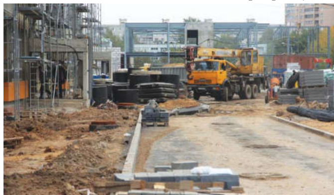
Сдача проекта намечена на конец текущего года