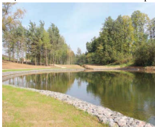
Силами местных жителей и инвесторов водный объект обогородили и сделали отличным местом отдыха