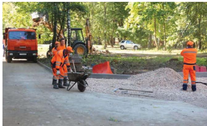
Строители стараются как можно меньше приносить неудобств жителям