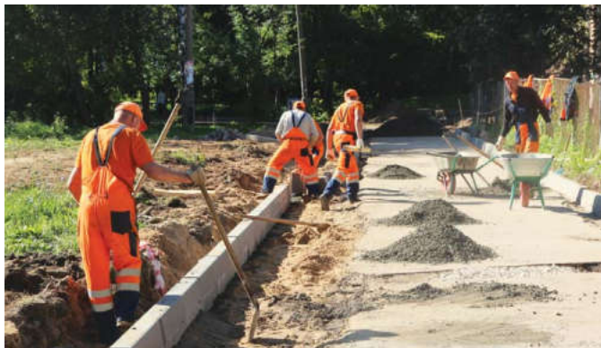
Завершение всех работ планируется к началу ноября

С 2005 года в Мытищах существует программа комплексного благоустройства микрорайонов города.