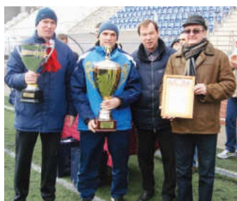
Обладателем Кубка главы стала команда «Мытищи-2»

Шесть команд из Чернигова, Жодино, Паневежиса, Ангарска и Мытищ боролись за Кубок главы городского поселения Мытищи. Наш город представляли сразу два коллектива.