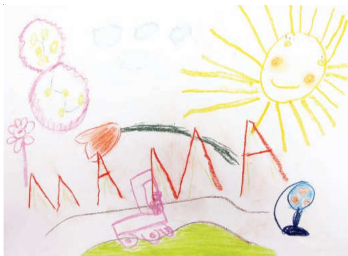
Даша Каманина, 4 года

Ответы на сканворд, опубликованный в № 7 от 1 марта 2014 г