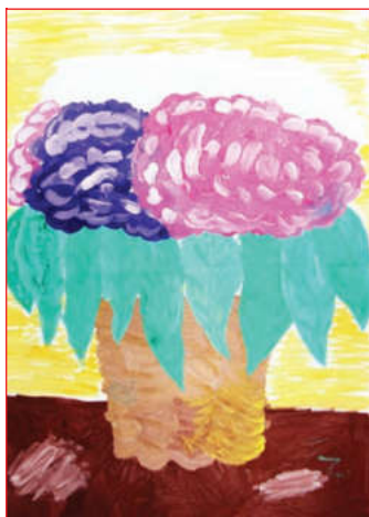
Алина Федориненко, 12 лет

Накануне 8 марта редакция еженедельника «НМ» получила несколько писем с рисунками для мам от мытищинских ребят. Сегодня мы эти работы публикуем. Пусть детские рисунки станут поздравлением для всех мам городского поселения Мытищи!