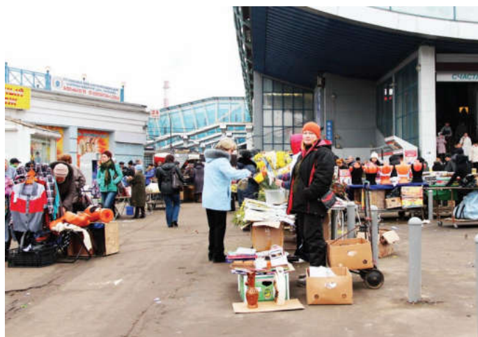
Вопрос обеспечения чистоты на пристанционной территории в администрации городского поселения поднимается постоянно

Особо хотелось бы остановиться на станции Мытищи. Вопрос обеспечения чистоты здесь в администрации городского поселения поднимается постоянно. Сменили подрядную организацию, отвечающую за порядок на этой территории. Ситуация изменилась, но, к сожалению, до полного порядка здесь еще далеко. Торговля, еже-