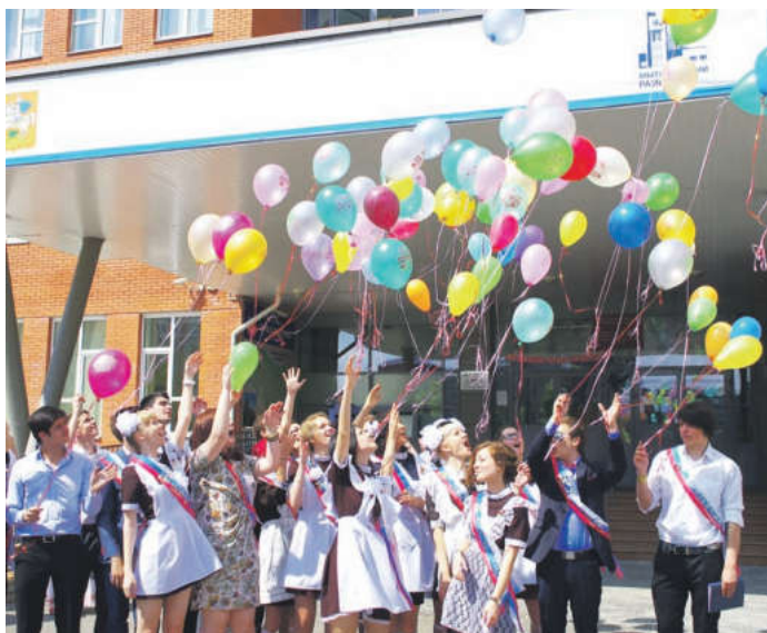
Каждая школа Мытищинского района постаралась сделать праздник последнего звонка ярким и запоминающимся

24 мая выпускники нашего города прощались со школой. Каждое учебное заведение постаралось сделать праздник последнего звонка для своих выпускников ярким и запоминающимся. Облаченные в нарядную школьную форму – мальчики в костюмах, девочки в белых фартуках и бантах – приняли участие в торжественных линейках.