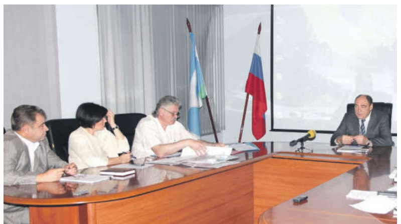
На заседании была рассмотрена концепция развития территории привокзальной станции Мытищи

Рассмотрение вопроса организации парковочного пространства касалось и станций Перловская и Тайнинская. Это достаточно сложные и крупные проекты, которые включают в себя строительство просторных современных автомобильных стоянок и благоустройство территорий. Под-