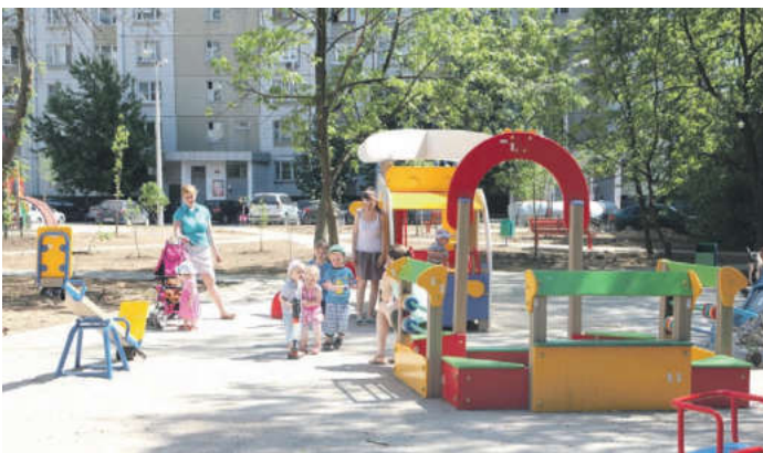
В этом году запланировано восстановить 50 детских площадок

Рассматриваем возможность хотя бы временного построения моста между центральной аллеей парка к рогонде, чтобы сделать замкнутый круг для прогулок по парку вдоль Яузы. Кроме того, надеемся, что нам все-таки передадут на освоение Пироговский лесопарк, который сможем благоустроить для спортивных прогулок. В городском парке есть беговая дорожка вдоль забора, но, к сожалению, все, чего бы мы хотели, в нем разместить невозможно.