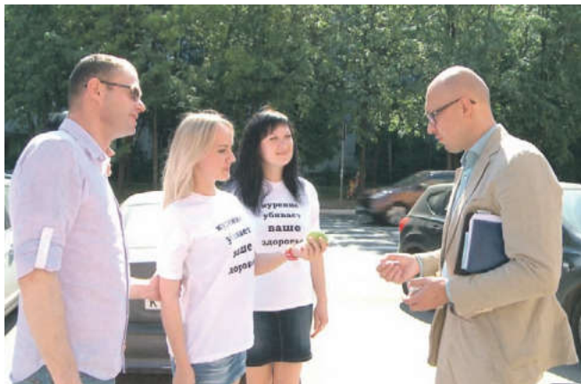
Активисты предлагали курильщикам произвести разумный обмен – сигарету на яблоко

ным последствиям табачной зависимости и снижению распространенности курения. Одной из первых в нашем городе в акции приняла участие городская поликлиника № 2.