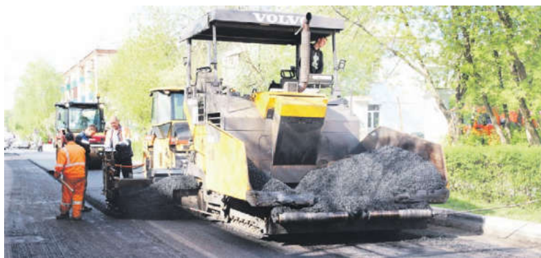
На данный момент ремонт дорог идет по графику