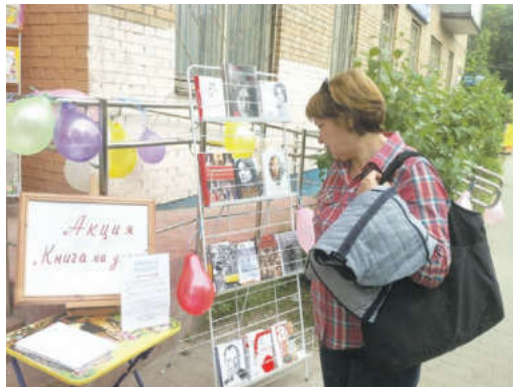
В этот день библиотека приобрела новых друзей

С утра у дверей библиотеки развернулось красочное действо. Шуточные плакаты, воздушные шары, музыка, книжные выставки, цветные указатели «Библиотека» – все привлекало зрителей своей необычностью, яр-