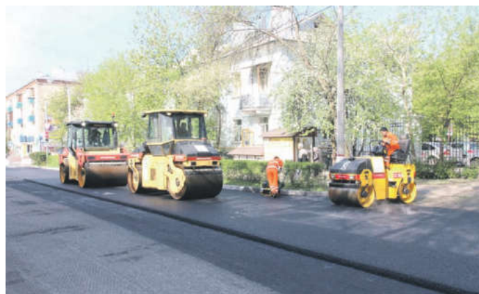
На ремонт дорог в этом году было выделено сначала 100 млн. рублей, потом дополнительно 50 млн. рублей

на капитальном ремонте дорог второй год, обладает хорошей базой, техникой и очень быстро проводит асфальтирование. Кроме этого, обязательное условие – качество. За этим следит специальная лаборатория.