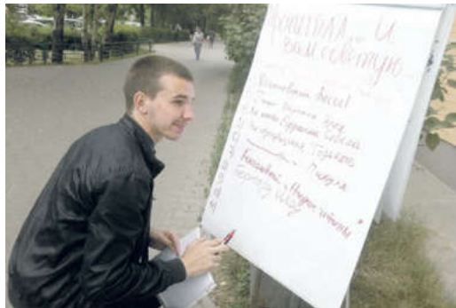
Прохожие принимали участие в опросе «Прочитал... и вам совету»

Никто из записавшихся в библиотеку в этот день не ушел без подарка. Дети получили воздушные шары и конфеты, взрослые – книги, а библиотека приобрела новых друзей.