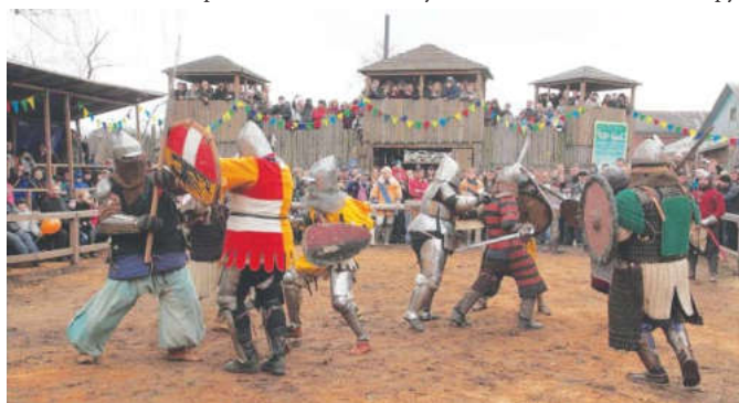
Участники из клуба «Ахерн» активно принимают участие в различных состязаниях

дирование и оружие современных рыцарей. «Доспехи и оружие стараемся делать сами. Однако для изготовления шлемов и мечей необходимо станки, поэтому их приходится покупать. Все остальное в наших ру-