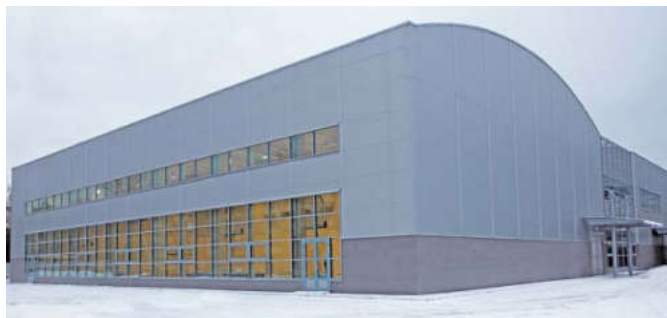
Торжественное открытие пристройки к «Арене Мытищи» состоится 27 февраля

В первую очередь участники выездного совещания обратили внимание на то, что необходимо будет доделать в ближайшие дни. Большинство помещений уже готово принять первых спортсменов. Однако в некоторых необходимо установить оборудование. В скором времени начнется монтаж тренажеров в помещении для физической подготовки игроков «Атланта». На входе в пристройку уже начата установка турникета и рамки металоискателя.