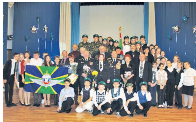
Ветераны-афганцы встречаются с молодежью, рассказывают о войне

«Все вернулись живыми! Так что, перед их матерями мне не стыдно.