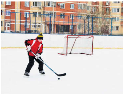
Состояние катков в Мытищах оценили сотрудники госадмтехнадзора

Домашняя Олимпиада – лучший повод обсудить состояние объектов для занятия физической культурой и подготовки будущих и нынешних чемпионов. Проверили спортивные сооружения и в Мытищах.