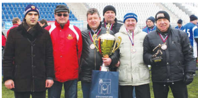
«Мытищи-1» и в этом году поборются за кубок

ны. Любительский клуб был организован для популяризации спорта в Мытищах и укрепления дружеских связей с городами-побратимами. К тому же для участников команды это хорошая возможность поддерживать себя в хорошей физической форме, благодаря тренировкам и играм. Футболисты каждый год проводят по несколько турниров.