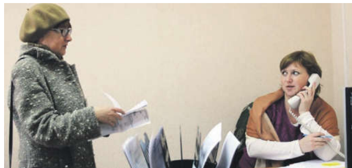
В мытищинской теплосети ведется ежедневный прием населения

Вопрос, который также интересует многих жителей: почему возникает разница между показаниями, снятыми автоматически теплосетью, и показаниями, которые списывают жители?