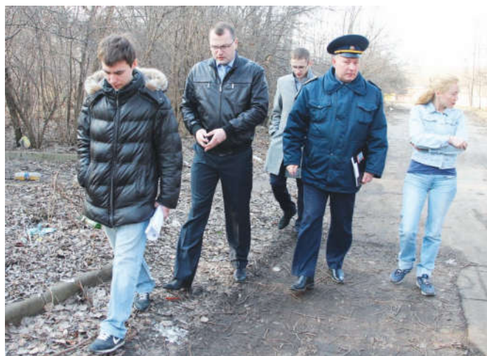
Сотрудники госадмтехнадзора совместно с работниками городской администрации на этой неделе побывали на улице Силикатной