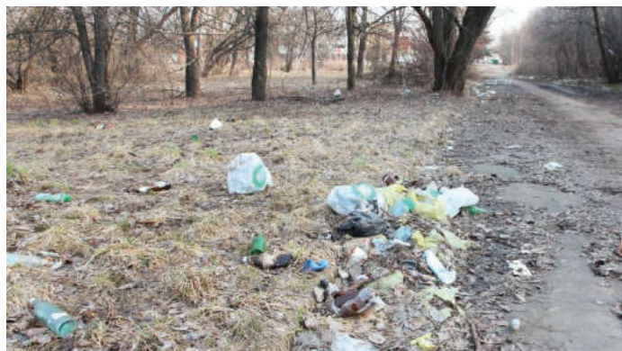
Пустырь между улицей Силикатной и железной дорогой еще совсем недавно имел неприглядный вид