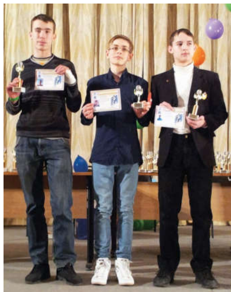
На этой неделе состоялось награждение победителей и призеров Кубка «Самопреодоление»