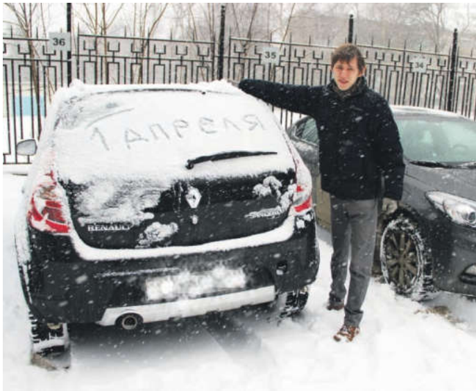
Первоапрельский снегопад стал неожиданностью для многих

Самой неожиданной шуткой 1 апреля в нашем регионе можно смело назвать снегопад. Когда все уже радовались наступлению теплых дней, погода преподнесла сюрприз, который совпал с Днем смеха.