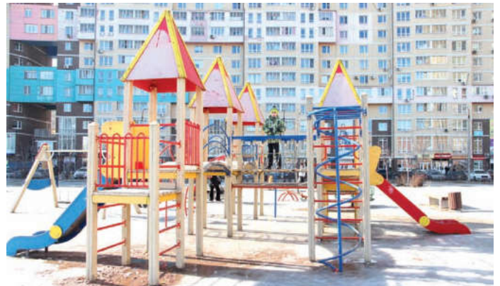
Детская площадка на ул. Комарова, 2

На очередном дне жилищно-коммунального хозяйства и строительного комплекса были представлены приближенные расчеты на содержание детских площадок. В результате оказалось, для того чтобы содержать их в исправном состоянии, вовремя ремонтировать и менять