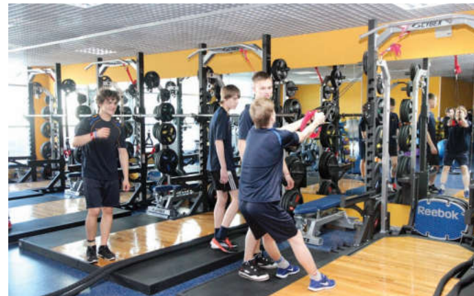
Для хоккеистов на первом этаже оборудован тренажерный зал