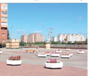
40% бюджетных средств прошлым году были направлены на благоустройство

гионе, – напомнил А. Казаков. – Только за последние 5 лет жилищный фонд увеличился на 1 млн. кв. м. Но реальность такова, что при этом в очереди на улучшение жилищных условий стоят еще 1557 семей».