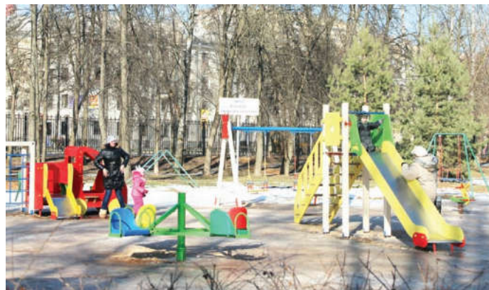
В Мытищах 530 детских площадок

Безопасность на детских и спортивных площадках должна стать приоритетом для муниципалитета. Глава городского поселения Мытищи А.М. Казаков предложил взять на баланс городского бюджета все детские площадки и поручил управлениям ЖКХ и по физической куль-