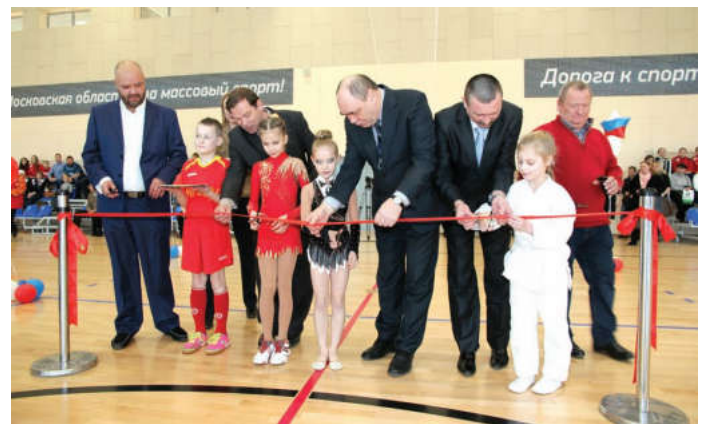
26 февраля состоялось торжественное открытие «Универсального спортивного комплекса»

Однако основная часть комплекса – это его залы. В них будут воспитываться будущие чемпионы. Самое большое помещение – универсальный спортивный зал. Его площадь составляет почти тысячу квадратных метров. В нем могут проводиться соревнования и тренировки по