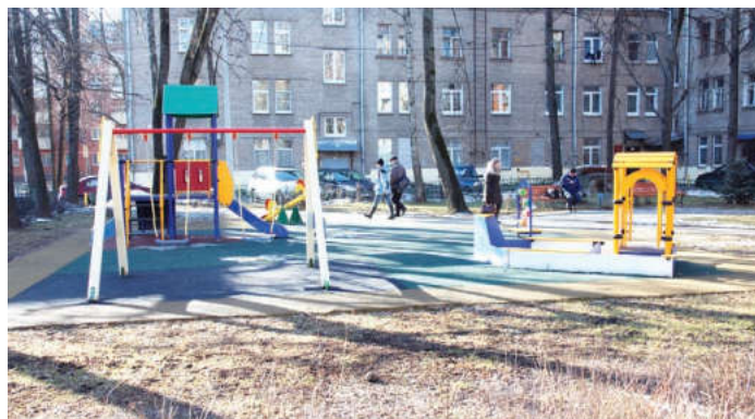
Безопасность на детских площадках города – приоритет для муниципалитета

– Старший сын вырос на старой детской площадке, а вот дочке повезло: в нашем дворе построили современную, красивую, безопасную площадку. Единственное, что огорчает: каждое утро на ней обнаруживаем бычки, шелуху от семечек, пустые бутылки. К сожалению, никак не можем достучаться до молодежки, которая вечерами собирается здесь. Родители должны воспитывать своих чад. А к инициативе относиться хорошо. Построить – одно дело, нужно потом все содержать в надлежащем виде, ремонтировать, а это немалые деньги.