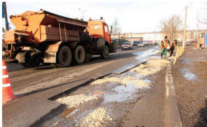
На этой неделе ямочный ремонт проводился на улице Колпакова

– В настоящее время сложились не совсем благоприятные условия для эксплуатации проезжей части. Перепады температур, от плюсовой днем до минусовой ночью, способствуют