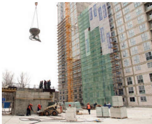
Наше муниципальное образование по-прежнему по темпам строительства жилья на лидирующих позициях в регионе

«Наше муниципальное образование по-прежнему по темпам строительства жилья на лидирующих позициях в ре-