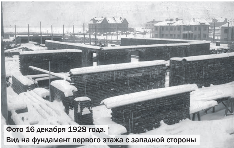
Фото 16 декабря 1928 года.

Вот что писал по этому поводу журнал «Московский пролетарий» (1928 г., №6):