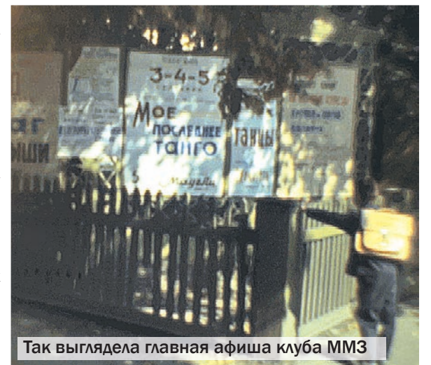
Так выглядела главная афиша клуба ММЗ