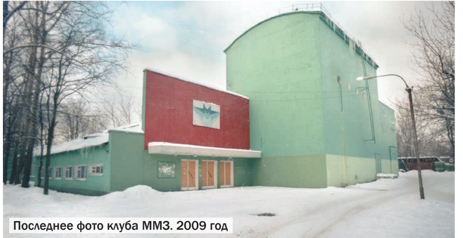
Последнее фото клуба ММЗ. 2009 год

В целом общий декор зрительного зала был очень богат. Шесть малых люстр, висевших на потолке, и одна огромная центральная люстра про-