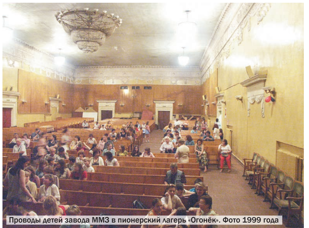
Проводы детей завода ММЗ в пионерский лагерь «Огонёк». Фото 1999 года