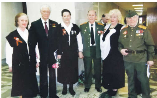
На концерт, посвященный Дню космонавтики, был приглашен дважды Герой Советского Союза Владимир Аксенов