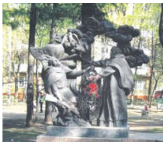
Памятник погибшим в годы Великой Отечественной войны и при взрыве 1943 года на заводе силикатного кирпича

Великая Отечественная война – это событие, которое в нашей стране затронуло каждую семью. Во всех городах, крупных селах, поселках и даже мелких поселениях стоят памятники героям, ушедшим тогда, в грозное военное время на защиту своей страны и не вернувшимся в отчий дом.