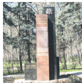
«Вечная слава героям – работникам Мытищинского электротехнического завода, павшим в Великой Отечественной войне 1941-1945 гг.»