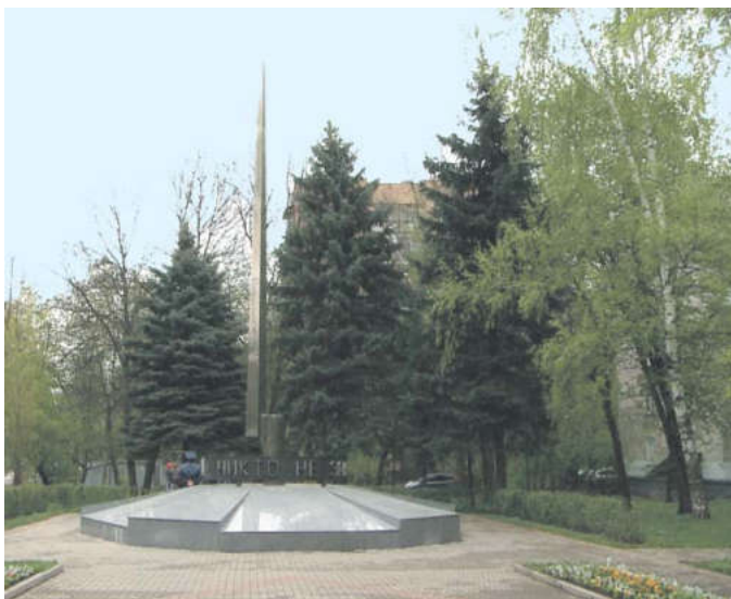
Суверенностью можно сказать, что все мемориальные места нашего города готовы к встрече великого Дня Победы