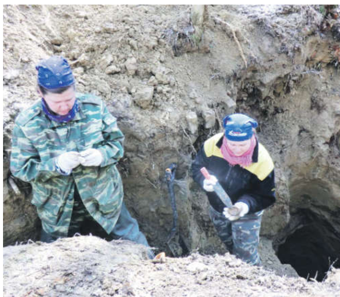
Девушки выполняют практически все обязанности, что и мужчины, за исключением тяжелой работы

да были и есть – обнаружение останков солдат, павших в годы Великой Отечественной войны, неучтенных мест захоронений и перезахоронение. Параллельно с этой работой ребята проходят хорошую туристическую подготовку, кроме того большое внимание уделяется патриотическому воспитанию. «Две недели в лесу смогут выдержать не каждый взрослый. Причем связь с внешним миром ограничена. Новости можно узнать только по небольшому радиоприемнику. Почти у всех ребят даже не возникает сомнений в том, что они будут служить. Был случай, когда одному из парней не прислали повестку, так он сам пришел в во-