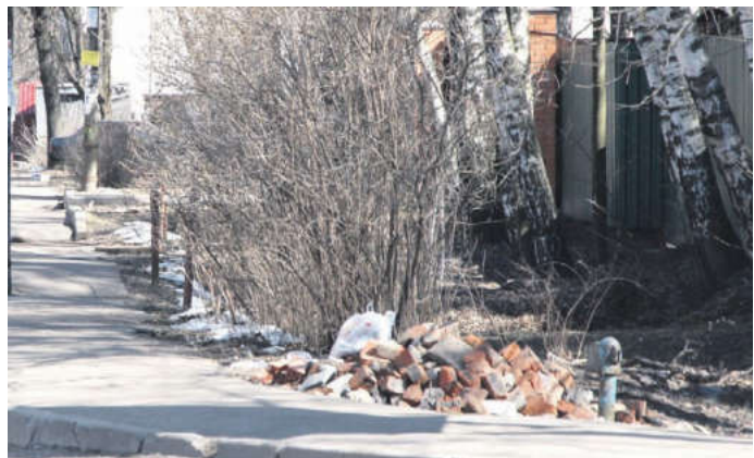
Несанкционированная мини-свалка на одном из перекрестков в микрорайоне «Дружба»

При этом выписывал штраф. Конечно, одними наказаниями проблему не решить, но помощь участковых в наведении порядка на улицах города была бы хорошим подспорьем.