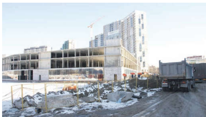
На всех строительных площадках застройщикам необходимо в недельный срок навести порядок

У компании ООО «Ковчег», которая возводит ЖК «Рождественский», есть обязательства по строительству футбольного поля, техническое задание по которому согласовано. Представители застройщика заверили, что проектные работы по этому социальному объекту уже закончены, в ближайшее время будут переданы на согласование и уточнение некоторых моментов. К этой компании возникли вопросы и по въезду-выезду грузовиков