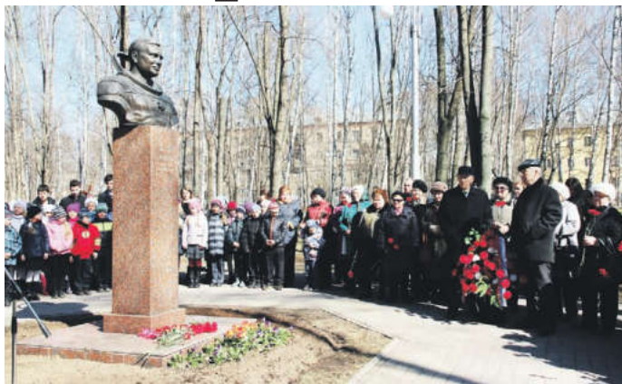
Накануне Дня космонавтики в сквере Стрекалова состоялся торжественный митинг

Приятно сознавать, что наш город внес свою лепту в развитие космонавтики. Мытищинцы, начиная с момента основания в Королеве коллектива разработчиков баллистических ракет дальнего действия, а это было в далеком 1946 году, продолжают трудиться в ракетно-космической корпорации «Энергия». В нашем городе родились два космонавта: Геннадий Стрекалов, пять раз побывавший на орбите, и Елена Кондакова – единственная российская женщина-космонавт, совер-