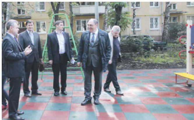
Александр Казаков положительно оценил качество нового покрытия на детской площадке

Второй объект, который осмотрел глава городского поселения Мытищи, расположен на улице Колпакова, 6. Работы по возведению площадки находятся на завершающей стадии. Александр Казакову понравились архитектурные формы, чего не скажешь о покрытии. По его мнению, гранитный отсев хопь и соответствует требованиям, но от применения необходимо отказаться. Он более травмоопасен, чем резина, да и его практичность вызывает большие сомнения. В будущем градоначальник потребовал отказаться от использования на детских площадках гранитного отсева. Он под-