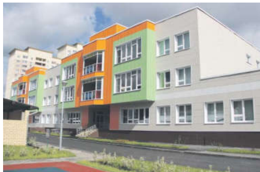
Уже в сентябре «Кораблик» примет в своих стенах 250 ребятишек

Праздник продолжился экскурсией, во время которой многочисленные гости осмотрели помещения. Заведующая показала игровые комнаты, спальни, пищеблок, прачечную, спортивный и музыкальный залы, медицинский блок. В здании также предусмотрены современные пла в а т е л ь н ы й бассейн, уютные детские спальни и игровые ком-