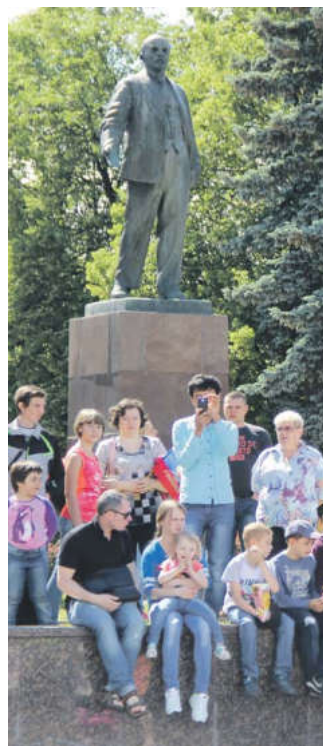
Полосу подготовила Ирина Каманина